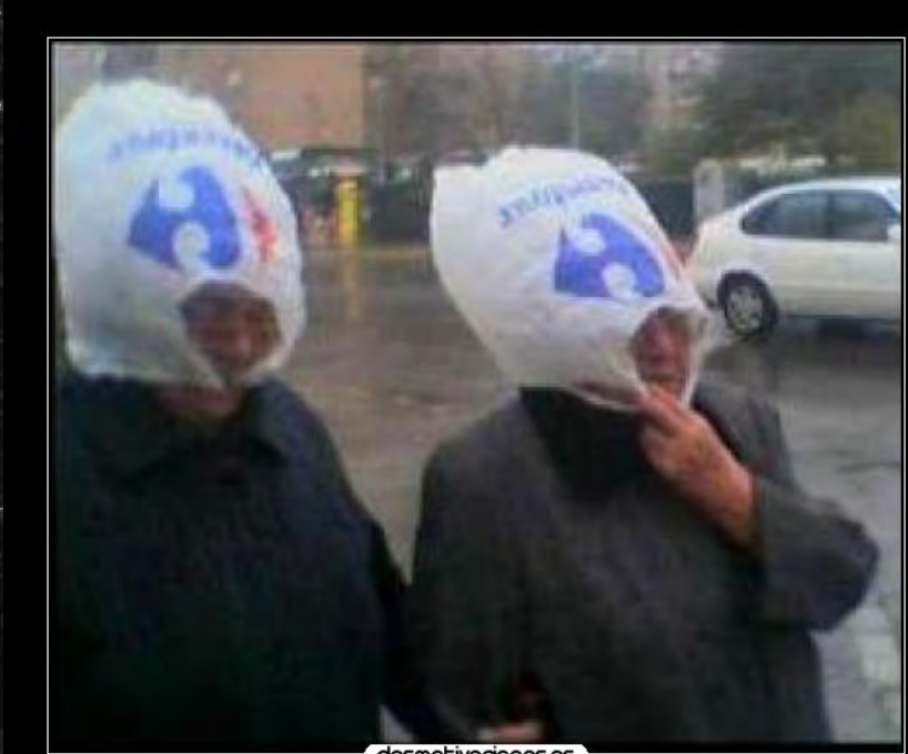
Señoras que se mojan porque ya no dan bolsas en Carrefour